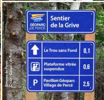
Géoparc de Percé