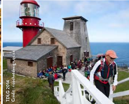
TDLG 2014