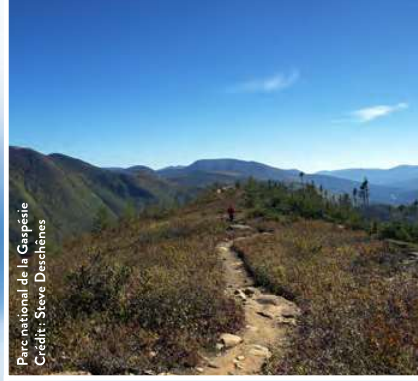
Parc national de la Gaspésie